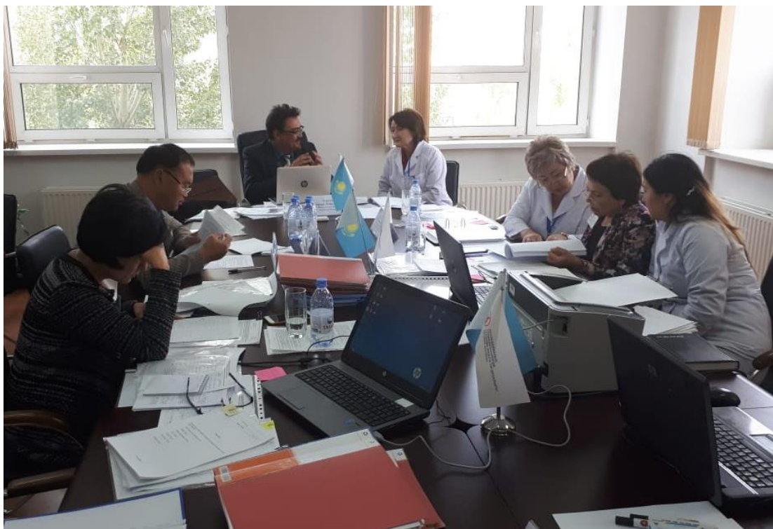
4 фото. ТҒӨО құжаттамасын зерделеу

Қорытындылай келе сарапшылар жұмыстың бірінші күнінің қорытындыларын талқылады, алған әсерлерімен бөлісті, аккредиттеудің бірқатар стандарттарына сәйкестігі бойынша пікір алмасты, ТҒӨО-ға сапардың екінші күніне іс-шаралар жоспарлады.