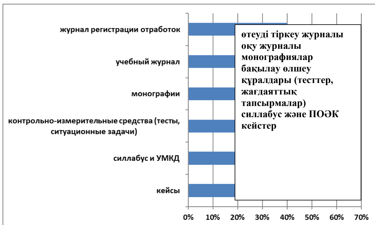
2 сурет. Қолданылатын оқу-әдістемелік материалдарға қатысты оқытушылар сауалнамасының нәтижелері

Оқытушылардың 90%-ы басшылық білім беру үдерісін, ҒЗЖ және клиникалық жұмысты ұйымдастыру кезінде олардың пікірлерін тыңдайтынын атап өтті. Жалақыға қанағаттану деңгейі туралы бөлек айту керек. Мұғалімдердің 60%-ы ғана «Жалақым мені қанағаттандырады» деген пікірмен келіседі, 60%-ы