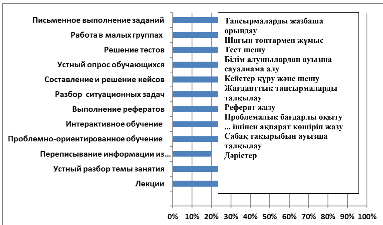
1 сурет. Тыңдаушыларды оқытудың қолданылатын әдістеріне қатысты оқытушылар сауалнамасының нәтижелері