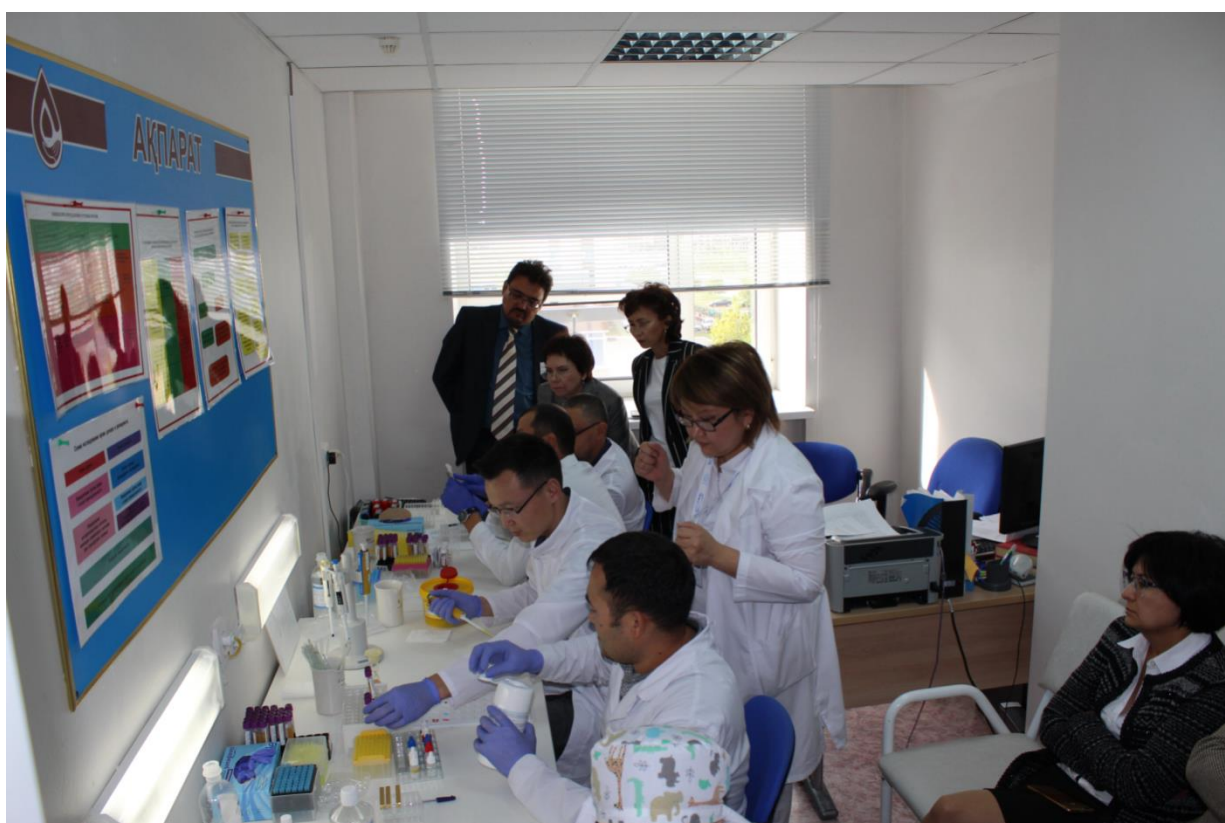
3 фото. ССК мүшелерінің практикалық сабаққа қатысуы

Барлық сұрақтарға тыңдаушылар толық жауап берді. Кездесу соңында тыңдаушыларға 26 сұрақтан тұратын бланкілік сауалнама жүргізілді.