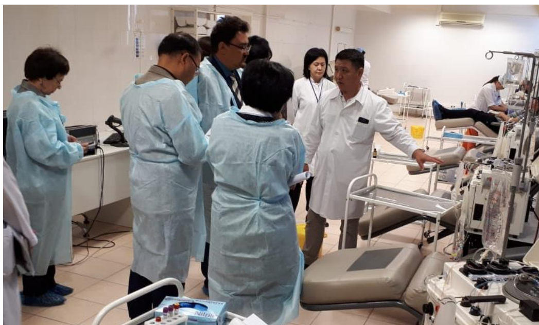
2 фото. ССК орталық бөлімшелеріне сапары