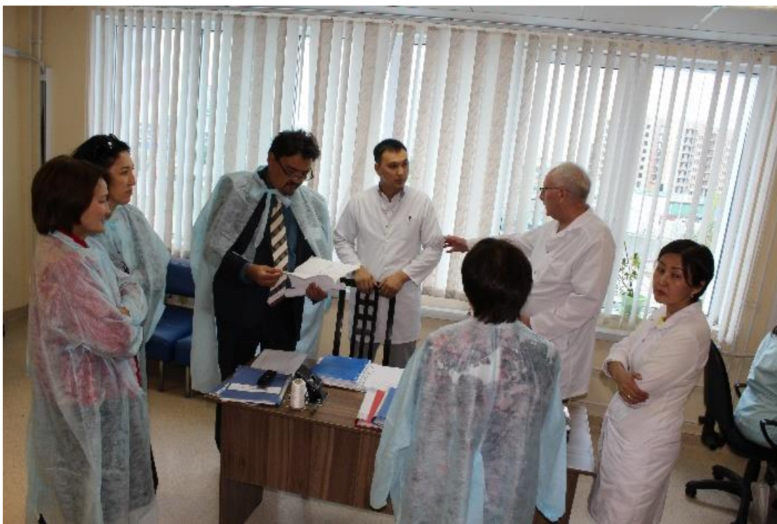
5 фото. Тәжірибе базасына сапар

Сапардың екінші күнінің соңында сапардың 2-күнінің және жалпы ССК жұмысының қорытындысы шығарылды. Тыңдаушылардың да, оқытушылардың да сауалнамаларының нәтижелерін өңдеу жүргізілді, күннің соңында институционалдық аккредиттеу қорытындылары бойынша сапа бейіні мен сыртқы бағалау критерийлері толтырылды. Есеп жобасы және ұйымның қызметін жақсарту бойынша ұсыныс дайындалды. ССК жұмысы үшін қолайлы жағдайлар жасалды, барлық қажетті ақпараттық және материалдық ресурстарға қолжетімділік ұйымдастырылды. Комиссия ТҒӨО корпоративтік мәдениетінің жоғары деңгейін, ССК мүшелеріне ақпарат беруде ұжымның ашықтығының жоғары дәрежесін атап өтеді.